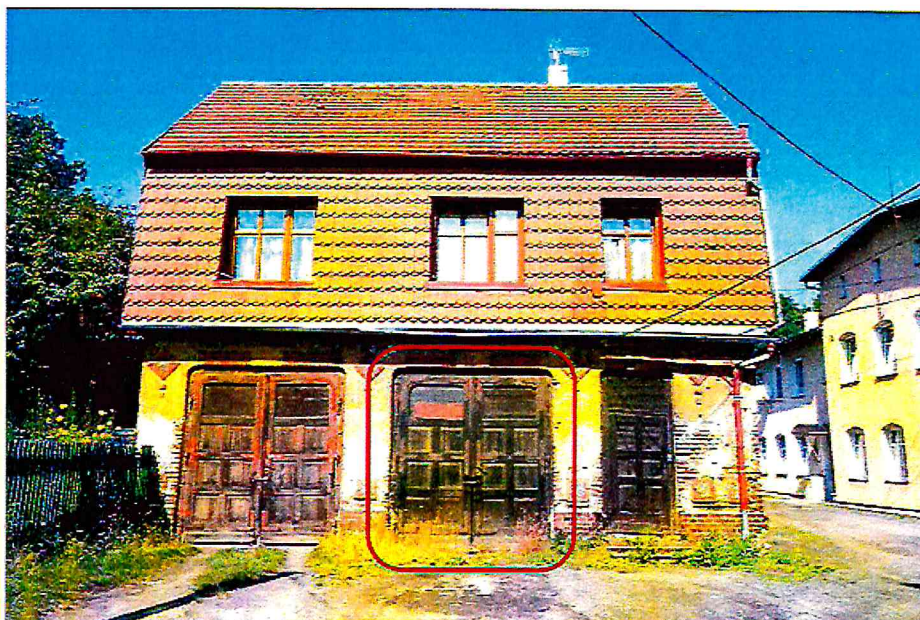
Ogólny widok fragmentu budynku i garażu.

Lokal inny niż mieszkalny – garaż, znajduje się w wielorodzinnym budynku mieszkalnym przy ul. Zawidowskiej 2c. W budynku znajdują się trzy lokale mieszkalne i dwa inne niż mieszkalne – garaże. Budynek wyposażony jest w instalacje energii elektrycznej, wodną (sieć miejska), kanalizacyjną (sieć miejska), gazową i telekomunikacyjną. Przedmiotowy lokal wykorzystywany na cele inne niż mieszkalne - garaż, położony jest na parterze budynku i składa się z jednego pomieszczenia z niezależnym wejściem(wjazdem).