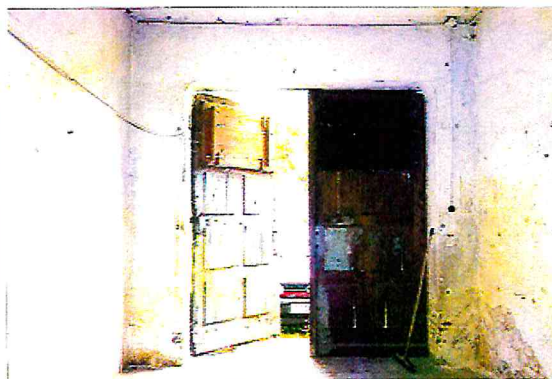
Widok wnętrza garażu.

Przedmiotowa nieruchomość, zgodnie z Uchwałą Rady Miasta Lubania nr XXXVIII/285/2005 z dnia 27 września 2005 roku, w sprawie miejscowego planu zagospodarowania przestrzennego obszaru położonego w zachodniej części miasta Lubania, położona jest na obszarze oznaczonym symbolem planu 1MU2 przeznaczonej tereny zabudowy mieszkalno-usługowej.